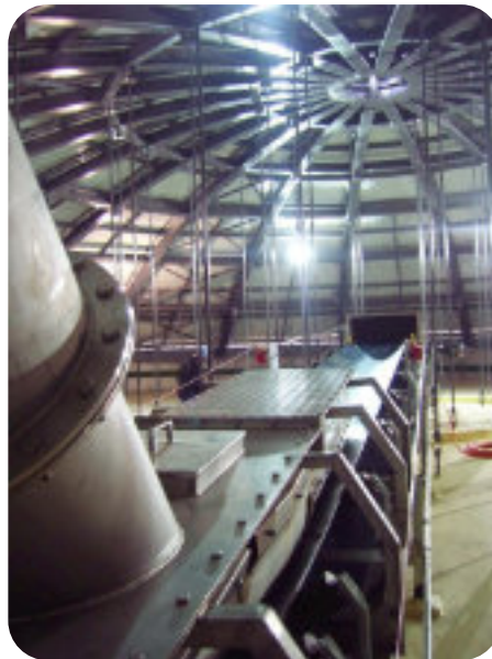
Correia para malte verde Conveying belt for green malt Correa transportadora para malta verde

For new projects or other needs, contact Zeppelin's application engineers.