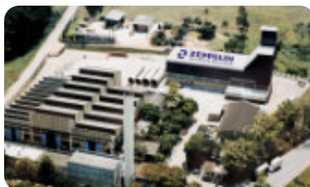
Vista aérea da fábrica Plant overview / Foto aérea de la fábrica