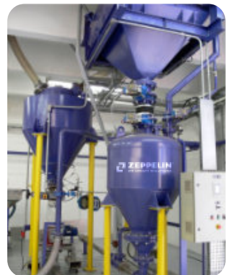
Centro de testes Test Center / Centro tecnológico

ZEPPELIN SYSTEMS LATIN AMERICA EQUIP. IND. LTDA