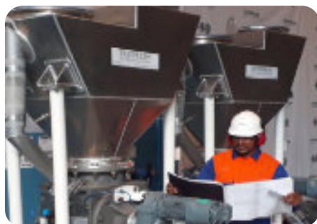
Mão-de-obra especializada Skilled personnel Mano de obra especializada

Para un nuevo, equipo de ingenieros de aplicación de Zeppelin Systems Latin America.