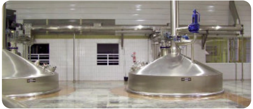
Rosca transportadora de inox / Screw conveyor - stainless steel Sistema de transporte por rosca de acero inoxidable

Para novos projeto consulte a equipe de engenheiros de aplicação da Zeppelin Systems Latin America.