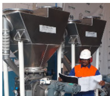
Mão-de-obra especializada Skilled personnel / Mano de obra especializada