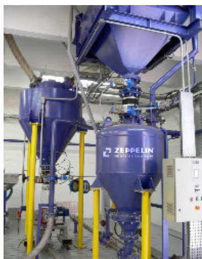
Centro de testes / Test Center Centro tecnológico