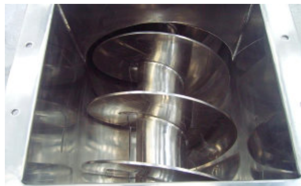
Rosca inox (Polimento - Grau sanitário). Stainless steel screw / Rosca de acero inoxidable