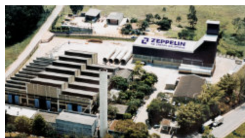
Vista aérea da fábrica / Plant overview Vista aérea de la fábrica